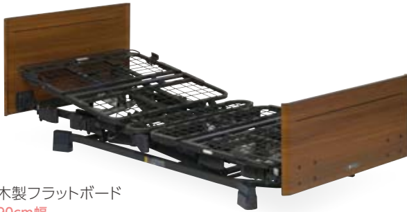
木製フラットボード 90cm幅 83cm幅