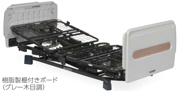
樹脂製棚付きボード (グレー木目調) 90cm幅 83cm幅