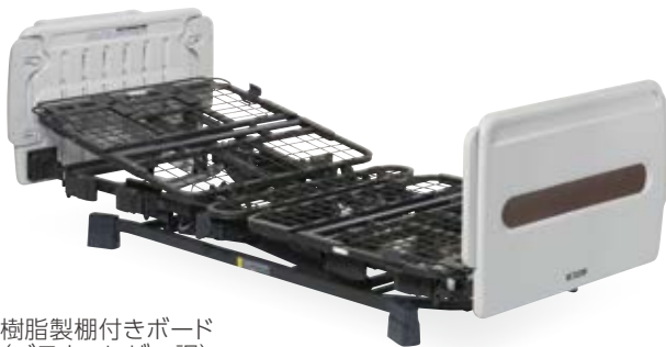
樹脂製棚付きボード (ブラウンレザー調) 90cm幅 83cm幅