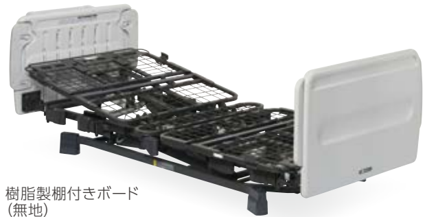
樹脂製棚付きボード (無地) 90cm幅 83cm幅