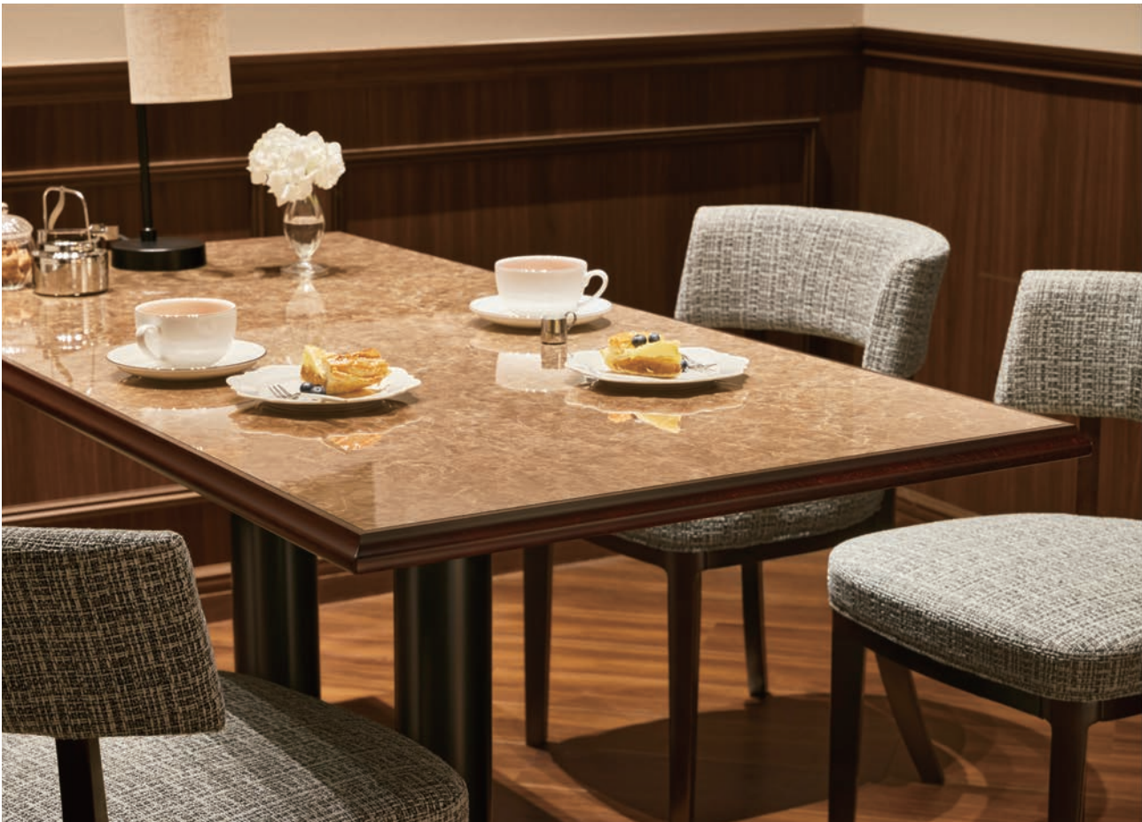
エクシス ▶ P066