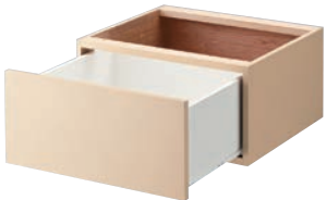
BASE C 引き出し式 （上部固定）