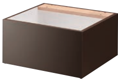
BASE A 座面取外し式