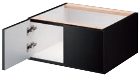
BASE B 扉式 （上部固定）