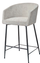
ロイクスタンドBL 21866-E D/布・ドルチェ03 塗装色：BL