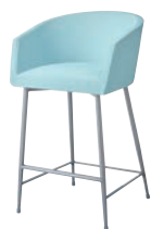
ロイクスタンドSG 21865-E C/レザー・ゼラファイト・プロL-6472 塗装色：SG