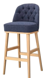
ガレルスタンドNA 11794-E D/布・カルドツイードII 05 塗装色：NA