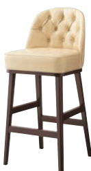
ガレルスタンドBR 11795-E B/レザー・サンセブンL-6742 塗装色：BR