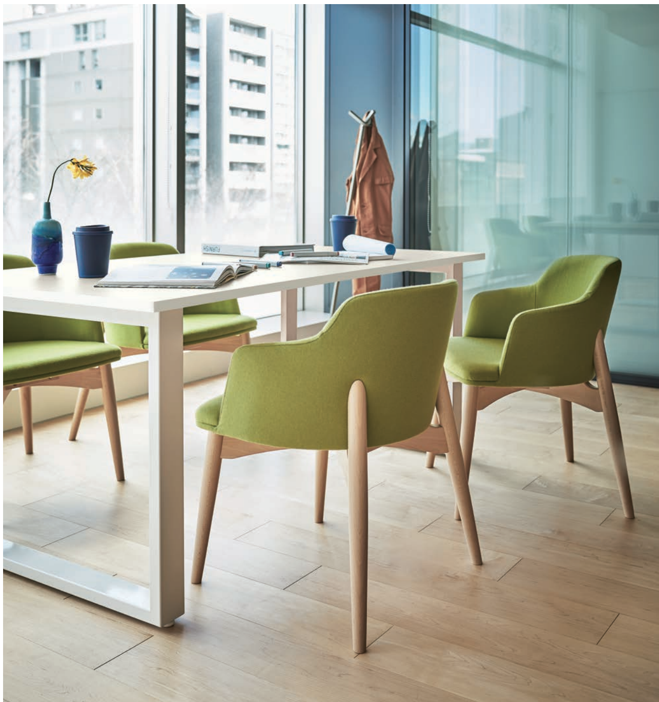
Table : Top ▶ P324 / Leg ▶ P341