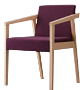
イッソウイスNA 11908-A D/布・ラット2010 塗装色：NA