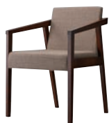
イッソウイスBR 11909-A C/布・エイガT-9204 塗装色：BR