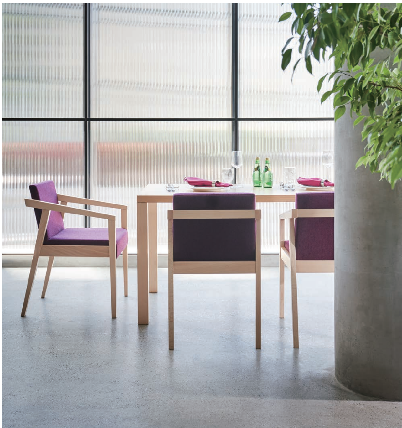
Table ▶ P304