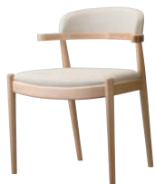
ブリーズイスNA 11985-A C/レザー・フロワ1