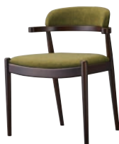
ブリーズイスBR 11986-A E/布・モコモ08