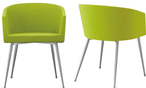
インクイスA-SG 21364-A E/布・パルパ031