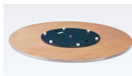
TANタイプ(スチール製回転金具)