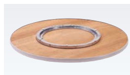
TAAタイプ(アルミ製回転金具)