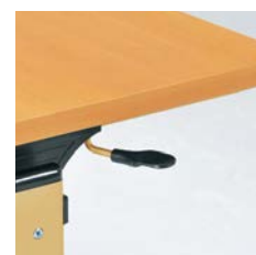
■折りたたみ操作レバー