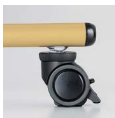
■アジャスト機能付キャスター

ABS樹脂エッジ(EB) 硬質タイプの樹脂エッジで耐久性・密着性に優れています。