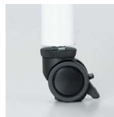
■アジャスト機能付キャスター

キャスター上部のリングにより 高さ調節できます。 制動力の高いリフトロック式ストッパー です。