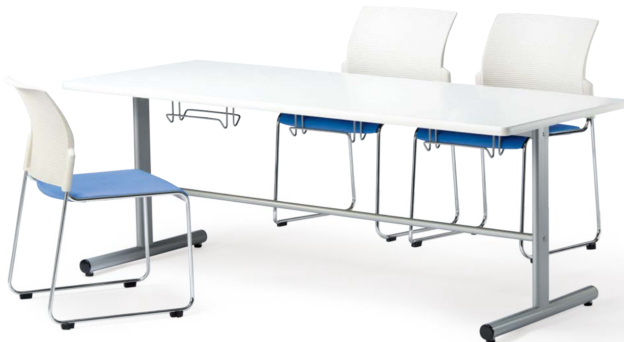
テーブル HGS-1875-WH チェア FC-88VW-BL (P.250)