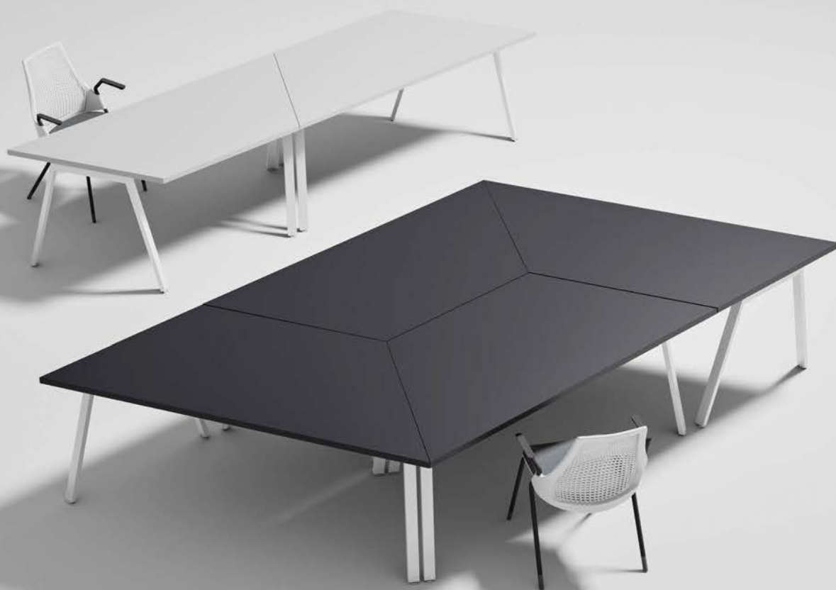
テーブル BSY-H1878D-OW BSY-H1878D-MG