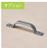
オプション スチール取手 S-TT ¥1,500

シナ合板 単板の表面にシナ材を張り、クリア塗装をした素材です。 ※テーブルクロスの使用を前提にご利用ください。