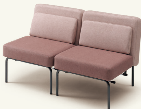
張材：背・クッション／B68-13、座／B68-15 →P.216