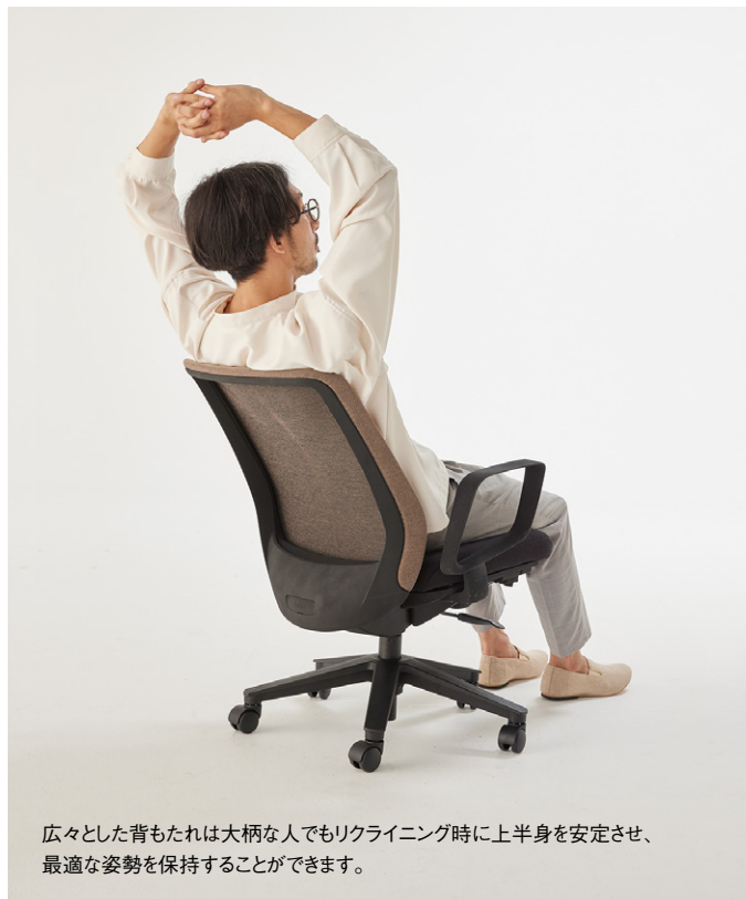
広々とした背もたれは大柄な人でもリクライニング時に上半身を安定させ、最適な姿勢を保持することができます。