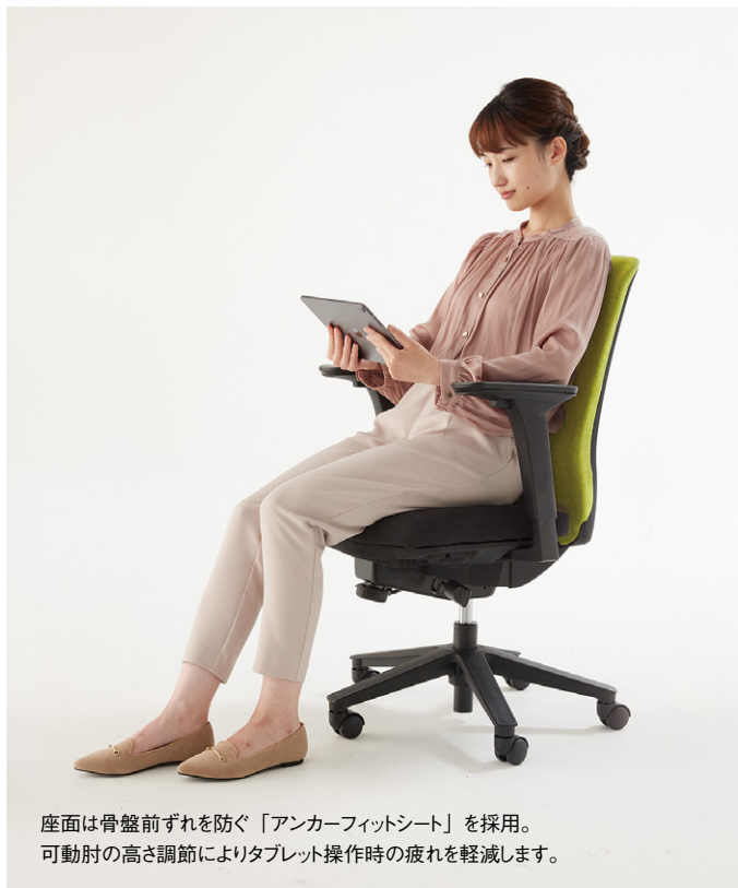
座面は骨盤前ずれを防ぐ「アンカーフィットシート」を採用。可動肘の高さ調節によりタブレット操作時の疲れを軽減します。