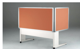
サイド用を取り付けた場合。(サイド用も高さ調節可能)