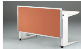
デスクトップパネルを下げた状態でモニターとしても使用できます。