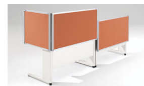
必要に応じて、隣合ったパネルの高さを段違いに設定できます。