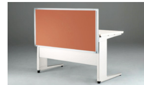
机上面より高さ350mmに設定した場合。