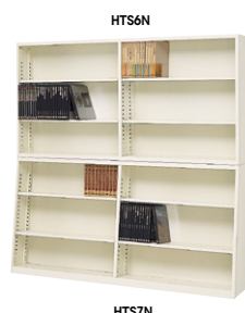
■上置用 HTS6N ¥92,100 ◇ 外寸法 / W1760×D250×H880 付属品:棚板4枚 ■下置用 HTS7N ¥107,200 ◇ 外寸法 / W1760×D250・350×H880 付属品:棚板4枚