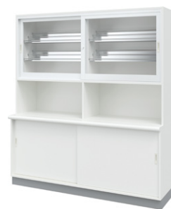
■薬品戸棚 NMB-5A ¥615,000 Ⓞ 外寸法 / W1800×D600(450)×H2000 樹脂コート化粧パーティクルボード 扉:スリムアルミ枠・透明強化ガラス 質量:205kg