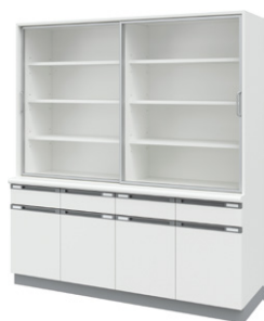
■食器戸棚 NKB-9A ¥587,000 Ⓞ 外寸法 / W1800×D600(500)×H2000 樹脂コート化粧パーティクルボード 扉:スリムアルミ枠・透明強化ガラス 質量:217kg