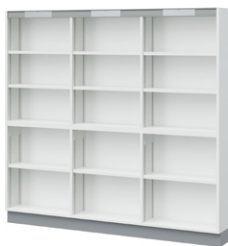
■垂直5段書架 NBP-150A-751 ¥303,000 Ⓞ 外寸法 / W1800×D240×H1700 樹脂コート化粧パーティクルボード 質量:93kg