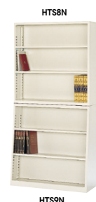
■上置用 HTS8N ¥60,300 ◇ 外寸法 / W880×D250×H880 付属品:棚板2枚 ■下置用 HTS9N ¥67,900 ◇ 外寸法 / W880×D250・350×H880 付属品:棚板2枚