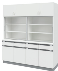
■食器戸棚 NKB-5A ¥652,000 Ⓞ 外寸法 / W1800×D600(500)×H2000 樹脂コート化粧パーティクルボード 扉:スリムアルミ枠・透明強化ガラス 質量:233kg