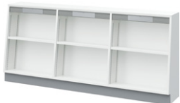
■傾斜付2段書架 NBP-220SA-751 ¥185,000 Ⓞ 外寸法 / W1800×D330(240)×H800 樹脂コート化粧パーティクルボード 質量:33kg