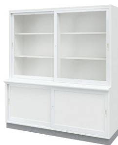
■標本展示戸棚 NMB-11A ¥587,000 Ⓞ 外寸法 / W1800×D600(450)×H2000 樹脂コート化粧パーティクルボード 扉:スリムアルミ枠・透明強化ガラス 質量:213kg