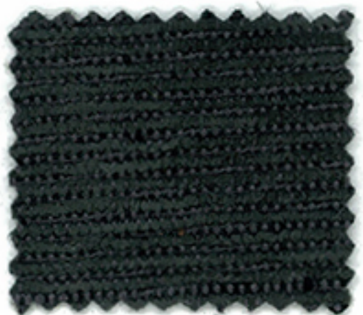
CGR チャコールグレー