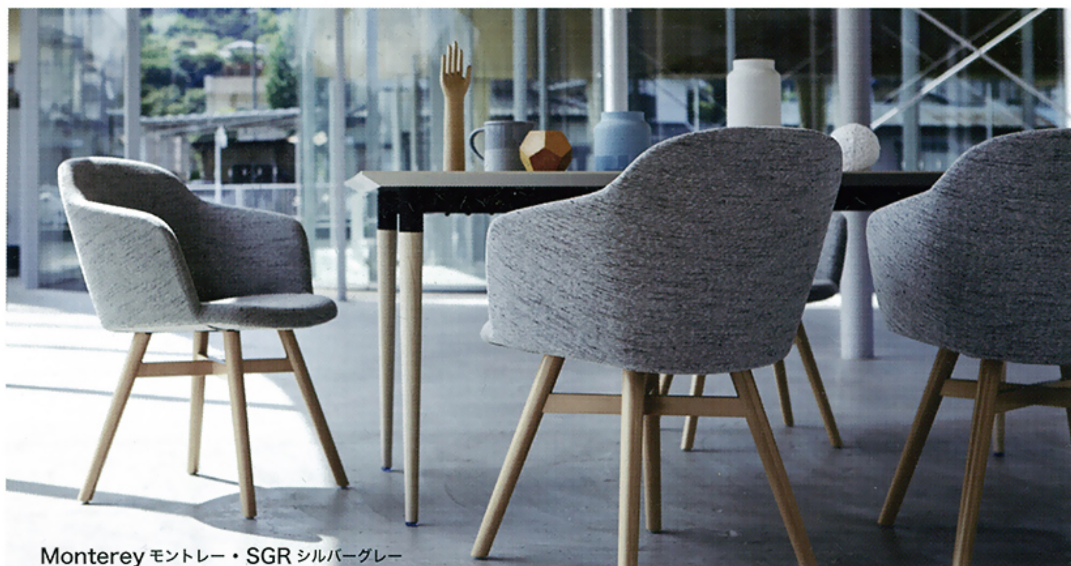
Monterey モントレー・SGR シルバーグレー