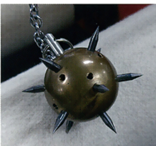
鉛のスパイクボール