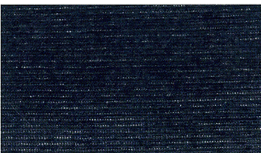
【ドリトル】2000 回転後試験片