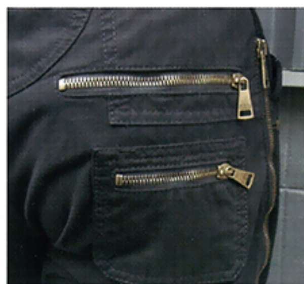
衣服についたファスナーや金具パーツなど