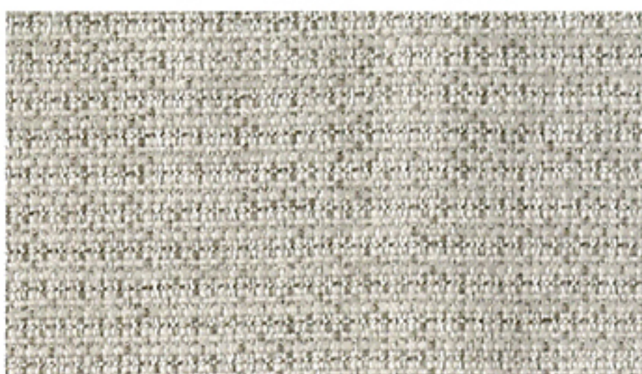
【レオン】2000 回転後試験片