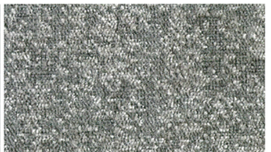
【ベルシア】2000 回転後試験片