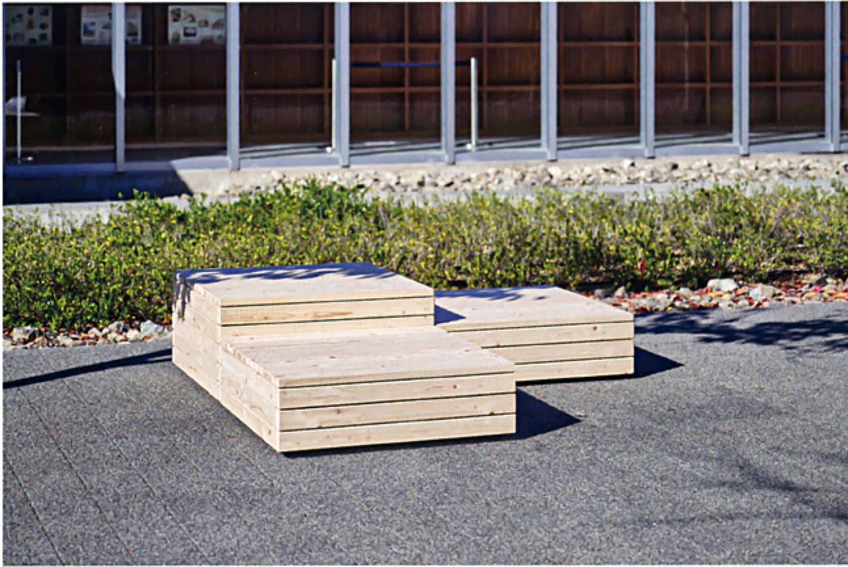
※写真のレイアウト構成/ST-9430H、ST-9280H×2