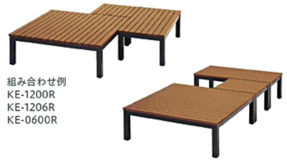
組み合わせ例 KE-1200R KE-1206R KE-0600R