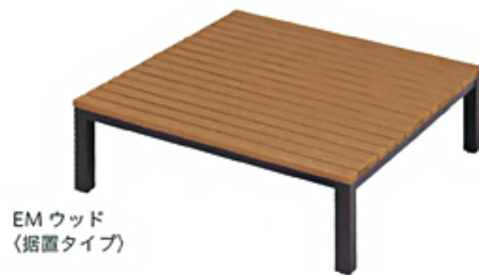
EM ウッド (据置タイプ)