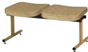
●2人用背なし ML-90-2 ¥73,700 W975×D475×H445 張地:C-DE