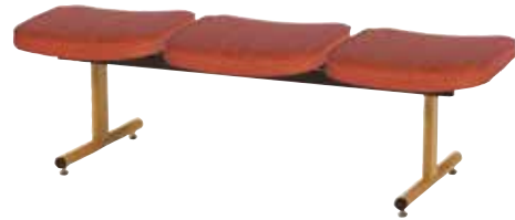
●3人用背なし ML-90-3 ¥91,700 W1475×D475×H445 張地:C-DE