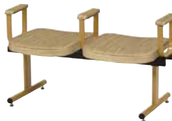
●2人用背なし・肘付 ML-90-2ARM ¥89,900 W1150×D475×H600 SH445 張地:C-DE