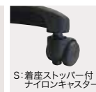
S: 着座ストッパー付 ナイロンキャスター 1セット(5ヶ) ¥6,400

脚先は動かずに作業ができる固定用のプラバート、カーペット床に適したナイロンキャスター、柔軟性があり床に傷が付きにくいウレタンキャスター、Pタイルやコンクリートなどの硬い床に適したゴムキャスター、荷重をかけると固定される着座ストッパー付キャスターをご用意しています。用途に合わせてお選びください。