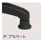
P: プラバート 1セット(5ヶ) ¥2,200

工場作業用・病院向けのスツールです。 硬質モールド成型ウレタンを使用して いますので長時間の作業も最適です。 座面のクッション材に『お尻の形』をし たミトノオリジナル「硬質モールド成型 ウレタン」を使用。座り心地が違いま す。あらかじめ、求める製品形状の型 (モールド)の空間に原液を注入し発 泡させた後、型から取り出し成型する 方法です。RIM成型と呼ばれるものは、 このモールド成型の一種で、高圧力下 で混合した原液を密閉モールド内に 射出して成型する方法です。