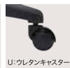
U: ウレタンキャスター 1セット(5ヶ) ¥3,800