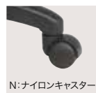
N: ナイロンキャスター 1セット(5ヶ) ¥2,200