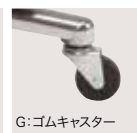
G: ゴムキャスター 1セット(5ヶ) ¥6,400