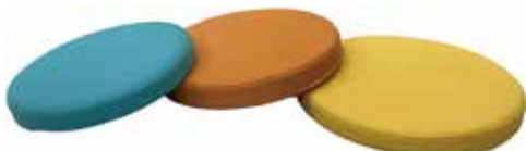
MZ-24 ¥8,200 φ330×H40 張地: C-MA 梱包: 10枚入