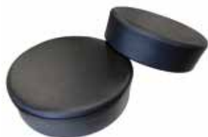
MZ-30 ¥11,600 φ380×H100 張地: A-MO 梱包: 5枚入