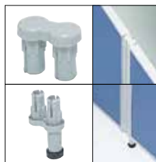
簡易固定連結樹脂セット(2方向) UT-2J ¥2,700 ※45°ピッチ設定可能