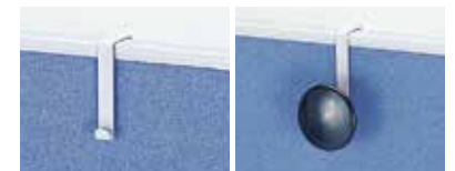
フック UT-J ¥4,100