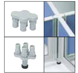
簡易固定連結樹脂セット(4方向) UT-4J ¥4,800 ※45°ピッチ設定可能