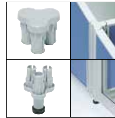
簡易固定連結樹脂セット(3方向) UT-3J ¥3,800 ※45°ピッチ設定可能