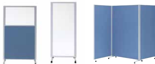
組み合わせ例 UT-1812U ×1 UT-F ×2