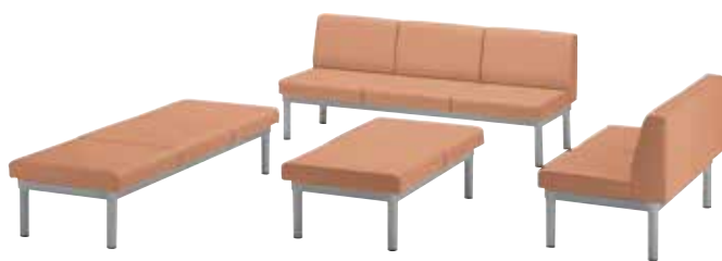
ZU-1401 (1人用背なし) ¥53,200 W550×D610×H380 質量：11.0kg ZU-1402 (2人用背なし) ¥90,700 W1100×D610×H380 質量：18.5kg ZU-1403 (3人用背なし) ¥121,200 W1650×D610×H380 質量：26.5kg