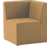
ZU-1502 ¥115,000 W600×D600×H700 SH400 質量：16.5kg