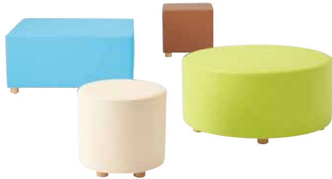
●丸型 ZU-1505 ¥41,300 W450×D450×H430 質量：5.7kg ZU-1506 ¥91,800 W900×D900×H430 質量：17.0kg

共通仕様 本体：木枠 ウレタンフォーム 脚部：60φラバーウッド クリア塗装 (ZU-1505～1508のみ)