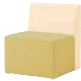
ZU-1501 ¥62,400 W600×D600×H700 SH400 質量：13.5kg