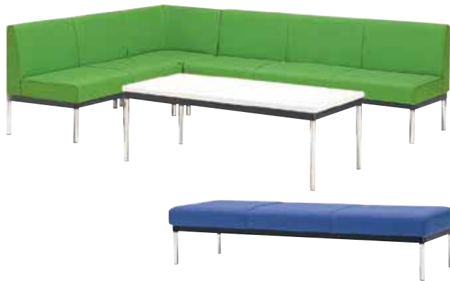
ZU-0601 (1人用背なし) ¥44,700 W550×D560×H370 質量：10.0kg ZU-0602 (2人用背なし) ¥58,800 W1100×D560×H370 質量：15.0kg ZU-0603 (3人用背なし) ¥72,300 W1650×D560×H370 質量：20.0kg ZU-0701 (テーブル) ¥55,300 W1200×D600×H430 質量：13.0kg

ビニールレザー張り：抗菌・防汚・耐次亜塩素酸・耐アルコール ライトグリーン ブルー ライトブルー イエロー オレンジ ローズ ホワイト アイボリー ベージュ ブラウン