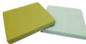
●マチ付タイプ MZ-29 ¥7,200 W400×D400×H50 張地:A-MO