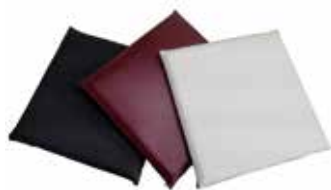
MZ-21 ¥9,400 W450×D450×H40 張地:C-MA