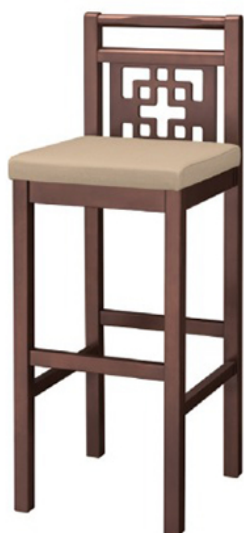
2140-2686 青島 D スタンド椅子 張地: マニエラ L-6359 (C)