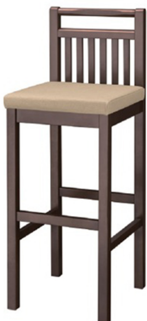
2140-2666 黒滝 D スタンド椅子 張地: マニエラ L-6359 (C)