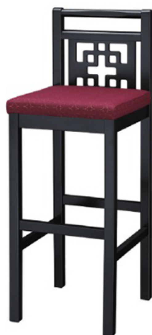
2340-2687 青島 B スタンド椅子 張地: 麻葉縹 UP-5473 (D)