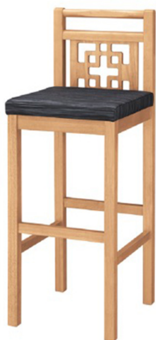
2040-2685 青島 N スタンド椅子 張地: デコア L-6321 (C)