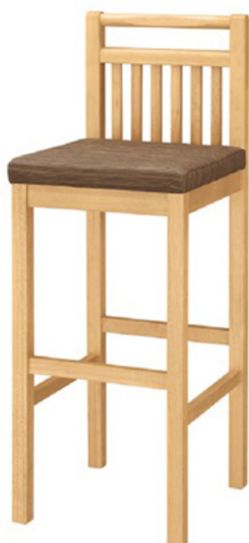
2040-2665 黒滝 N スタンド椅子 張地: デコア L-6320 (C)