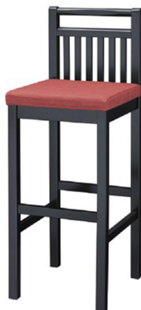
2340-2667 黒滝 B スタンド椅子 張地: デコア L-6315 (C)