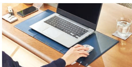
マウスパッドとしても使用できます。