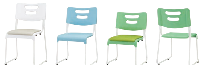
SF-SC-WS5 ホワイト SF-SC-WN4 ブルー SF-SC-WS3 グリーン SF-SC-WN4 グリーン