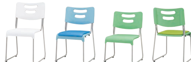
SF-SC-SN5 ホワイト SF-SC-SS4 ブルー SF-SC-SN3 グリーン SF-SC-SS4 グリーン