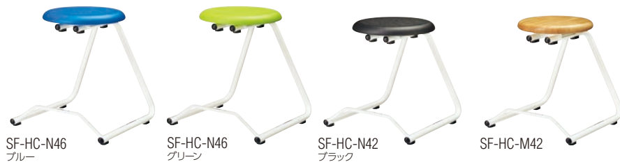
SF-HC-N46 ブルー SF-HC-N46 グリーン SF-HC-N42 ブラック SF-HC-M42

安定して積み重ねられる垂直スタッキング式。キャスター付のテーブル等にハンギングさせたままでの移動も可能です。フットステップ付で、子どもたちの身長差をカバーします。