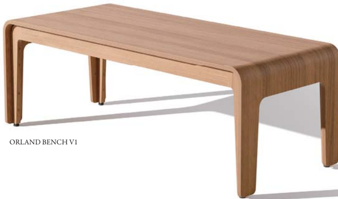
ORLAND BENCH V1