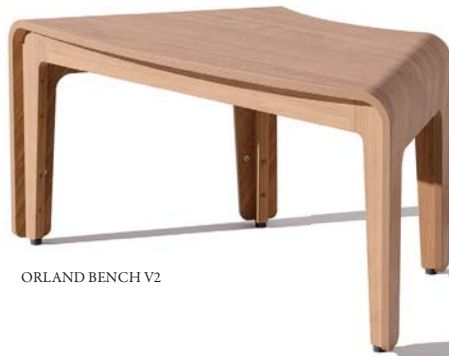
ORLAND BENCH V2