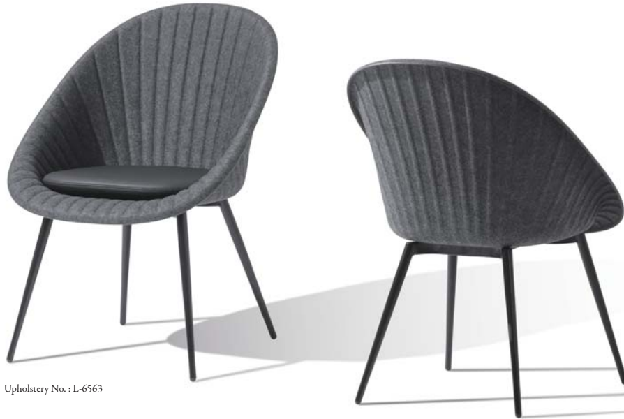
Upholstery No. : L-6563