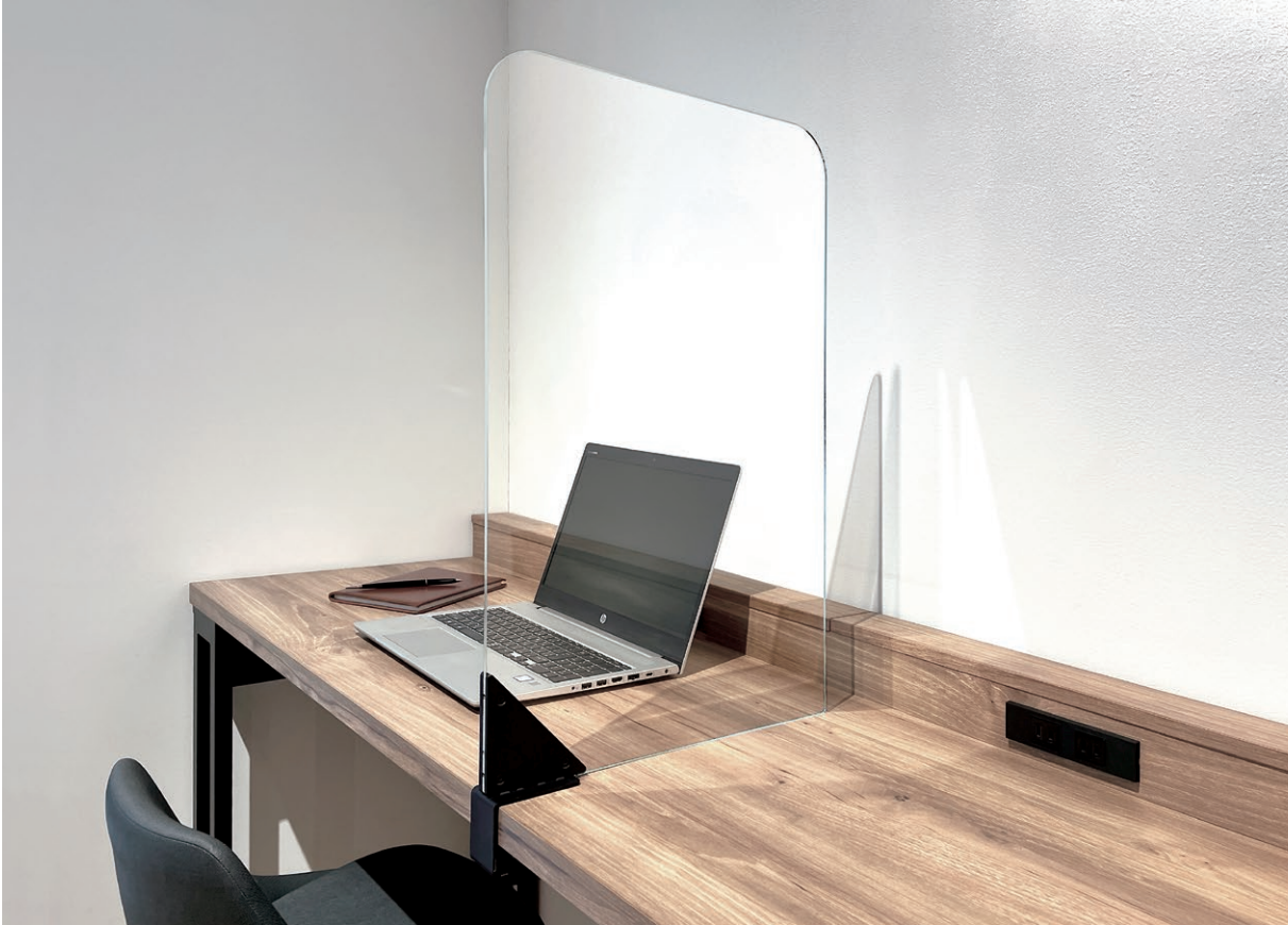
クランプ取付式の飛沫防止用アクリルパーティション。 Clamp-mounted acrylic partition plate.