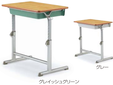
グレイッシュグリーン

環境に充分に配慮しながらも、 画期的な操作性と堅牢性を併せ持つ 高いデザイン性の上下可動式モデル。