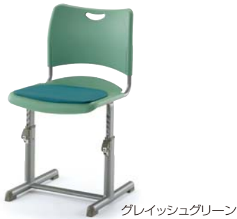
グレイッシュグリーン