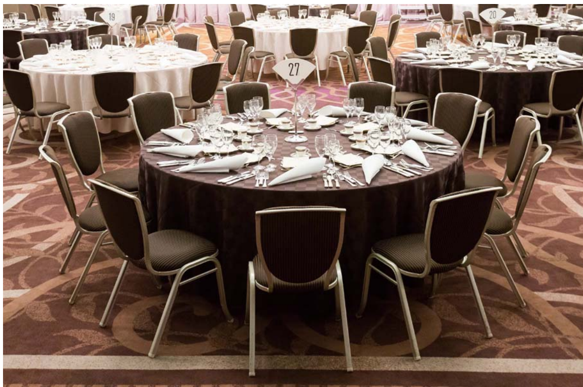
写真は別張りです。