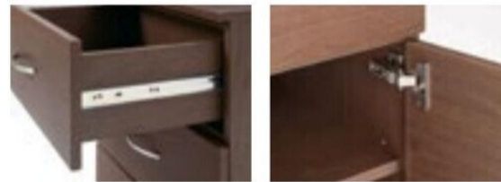
ダブルスライドレール