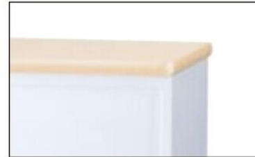
天板はソフトエッジ仕様。