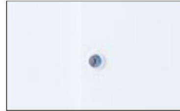
開閉表示付きリバーシブルキー。