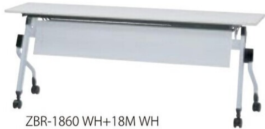
ZBR-1860 WH+18M WH