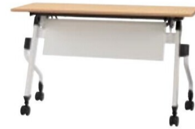
ZBR-1245 NA+12M WH