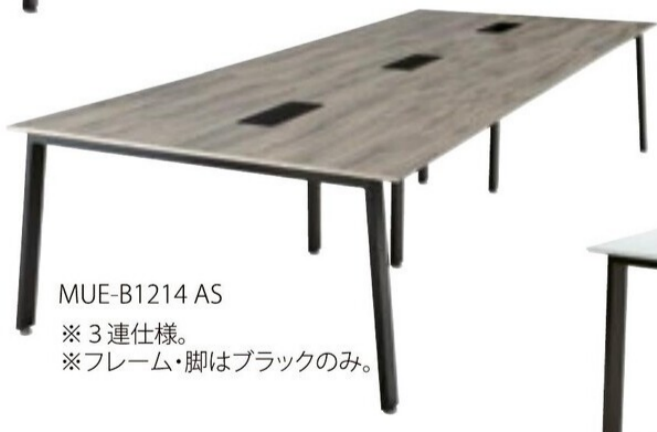
MUE-B1214 AS ※3連仕様。 ※フレーム・脚はブラックのみ。