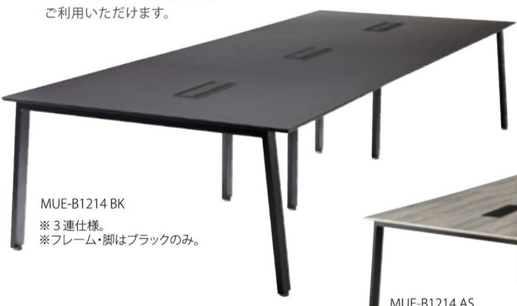
MUE-B1214 BK ※3連仕様。 ※フレーム・脚はブラックのみ。