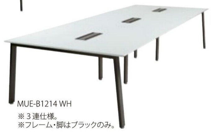
MUE-B1214 WH ※3連仕様。 ※フレーム・脚はブラックのみ。