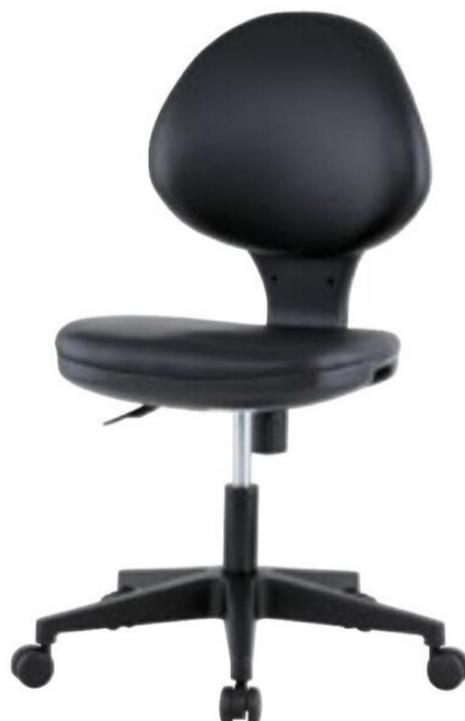
BK ブラック (PVC) GY-P129N BK