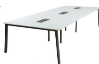
MUE-B1214 WH 3連仕様