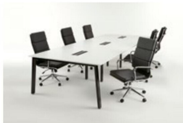
MUE-B1214 WH 3連仕様+APS-H04