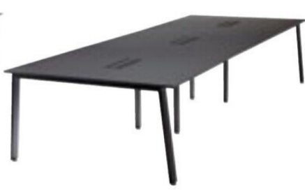
MUE-B1214 BK 3連仕様