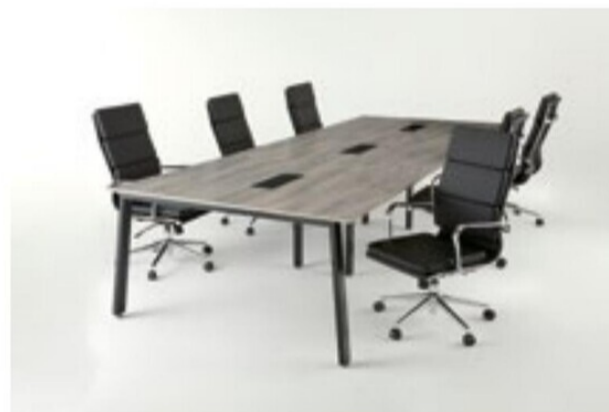
MUE-B1214 AS 3連仕様+APS-H04