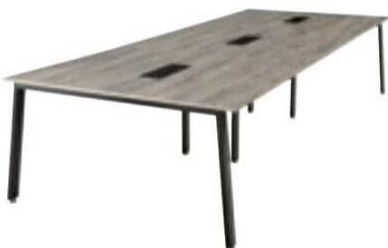
MUE-B1214 AS 3連仕様