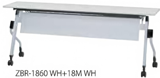
ZBR-1860 WH+18M WH