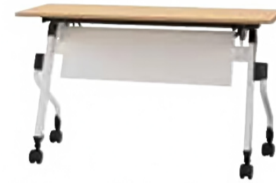
ZBR-1245 NA+12M WH