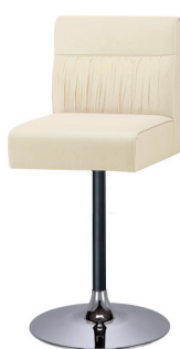
YS脚 ブラック クロムメッキ