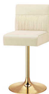
YS脚 ゴールドメッキ