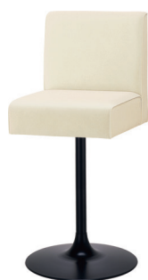
YS 脚 ブラック

※張地ランクSSの価格はWEBサイトにてご確認ください。 ※お客様組立品です。(完成品出荷は別途組立費と差額送料が必要になります)