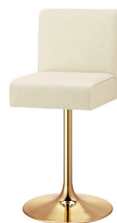
YS 脚 ゴールドメッキ