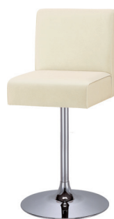
YS 脚 クロムメッキ