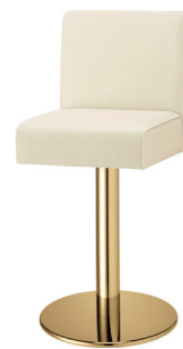
SS 脚 ゴールドメッキ