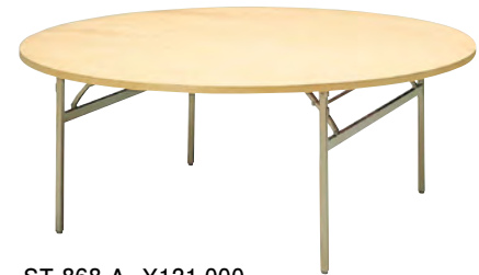
ST-868-A ¥121,000 W1800φ H700