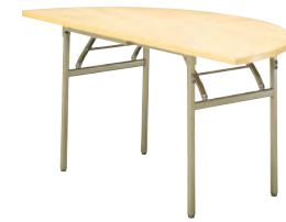
ST-872-A ¥55,000 W1500 D750 H700