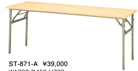
ST-871-A ¥39,000 W1800 D450 H700