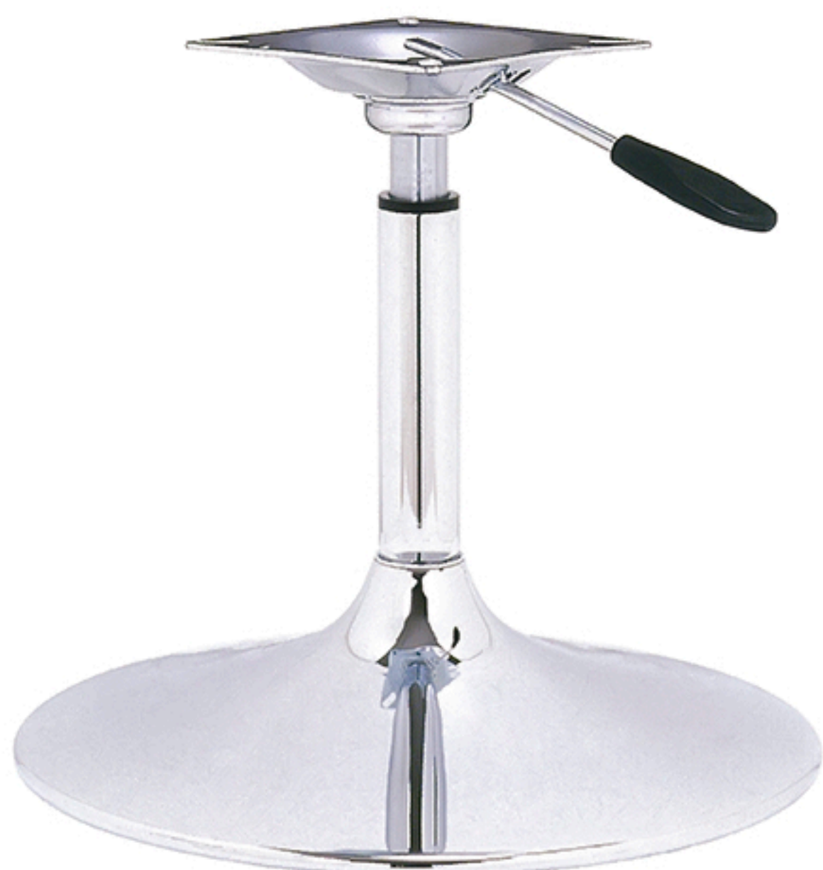
11-G [ H465mm L355mm