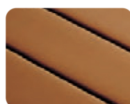
単色ローレット加工