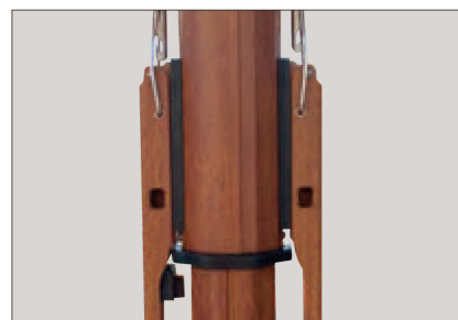
木目調フレーム Wooden Frame Finish