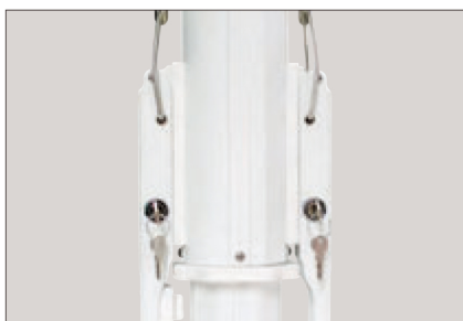
ホワイト色 Traffic White RAL9016